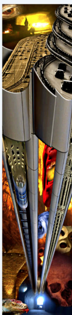
"L'Inferno secondo me". Tratto dal trittico "Inferno, Paradiso e Purgatorio" dell'Autore.