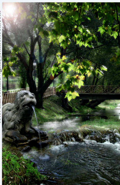
Elaborazione di immagini dell'Autore: proposta per una copertina di un libro sul fiume Sarno.