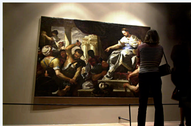
Mostra a Castel S.Elmo di Luca Giordano. Pubblicata su ULISSE / ALITALIA n°242.