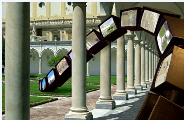
Elaborazione di immagini dell'Autore: Certosa di San Martino e Città della Scienza. Progetto FANTANAPOLI.