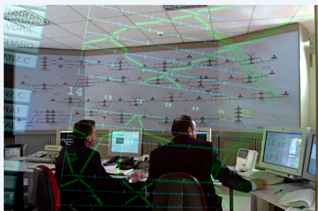
Servizio realizzato per ANSALDO SIGNAL.