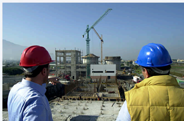
Cantiere di depurazione a Scafati.