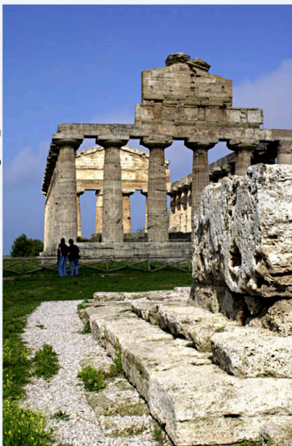
Tempio di Cerere. Paestum -Salerno-