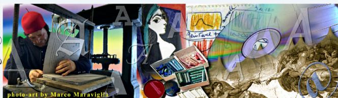
Elaborazione di immagini dell'Autore per il fronte di una proposta di segnalibro dedicato all'evoluzione dell'arte e della stampa.