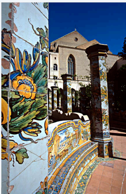
Chiostro di S. Chiara -Napoli-. Pubblicata sul n°2 anno II della rivista EUROSTAR (GRIMALDI).