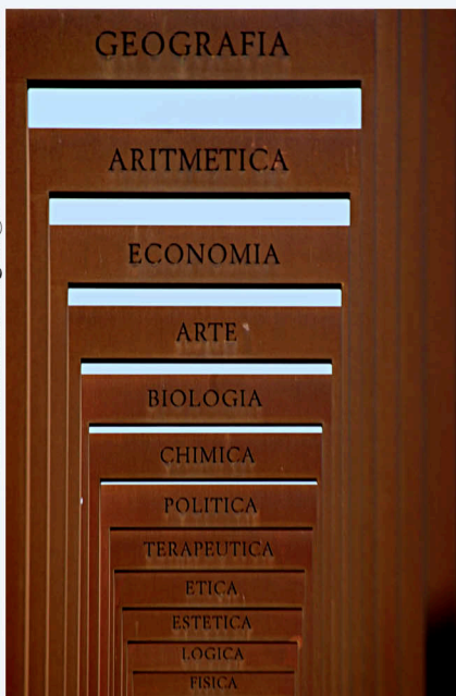
Via della Sapienza a Città della Scienza (Napoli). Servizio realizzato per MERIDIANI / DOMUS n°139 -Napoli, Costiera, Isole-